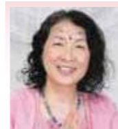
くくり姫 タロット占い

四柱推命、人相占い、鑑定、前世リーディング等々特別価格で個人セッションを受けられます。お早目の予約をお待ちしております。