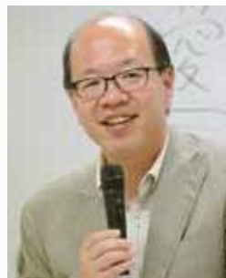
株式会社 船井本社 代表取締役社長